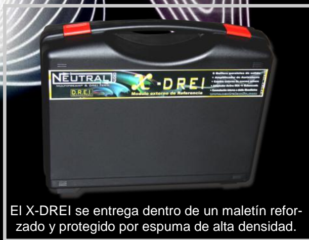
El X-DREI se entrega dentro de un maletín reforzado y protegido por espuma de alta densidad.